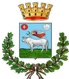
Comune di Bojano Assessorato alla Cultura