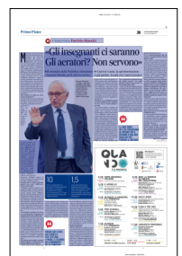
Peso: 1-4%, 3-63%

contro la dispersione scolastica, su cui abbiamo lanciato un Piano nazionale che, da solo, vale 1,5 miliardi. Abbiamo riformato gli Istituti tecnici superiori che danno lavoro all'89 per cento dei diplomati: sono necessari per la